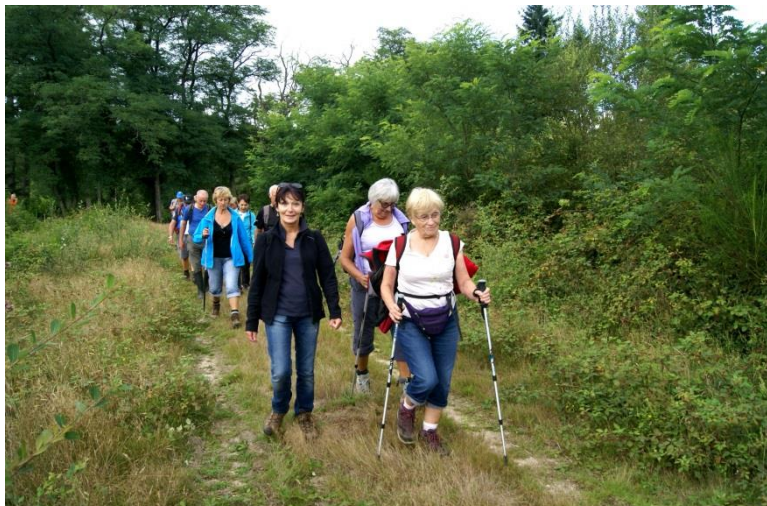
Rando du jeudi

Si vous voulez venir nous rejoindre, c'est avec grand plaisir que nous vous accueillerons.