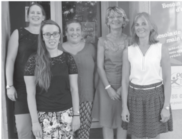
de gauche à droite