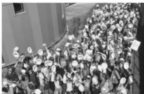
Concours écoloustics : remise des prix départementaux 2018 à l'Aquapolis

Expert public de l'énergie en Haute-Vienne, le SEHV propose des actions de sensibilisation et d'animation indépendantes et gratuites sur cette thématique. Il invite ainsi enfants et adultes à la réflexion, l'action et l'expérimentation pour échanger sur les enjeux liés à l'énergie. Ses outils : une exposition itinérante intitulée « Le parcours de l'énergie », et un concours soutenu par l'éducation nationale : les écoloustics (330 participants 2017-2018).