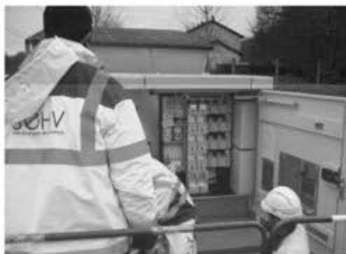
300 emplois générés en Haute-Vienne par les travaux du SEHV

Le SEHV engage chaque année plus de 15 Millions d'euros de travaux sur les réseaux de distribution d'énergie électrique (moyenne et basse tensions). En 2017, 53 km ont été déposés et 83 km ont été construits (en technique souterraine à 85%). Ces travaux sont confiés à des entreprises via une procédure de marchés publics. Ils génèrent plus de 300 emplois sur la Haute-Vienne, selon le SRER (Syndicat Régional des Entreprises de Réseaux).