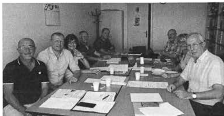
Photo prise lors du Conseil d'Administration du 03 septembre 2019

L'activité de Pouce travail est en hausse en 2018 : 65 68 heures ont été réalisées par 183 salariés auprès de 800 clients :