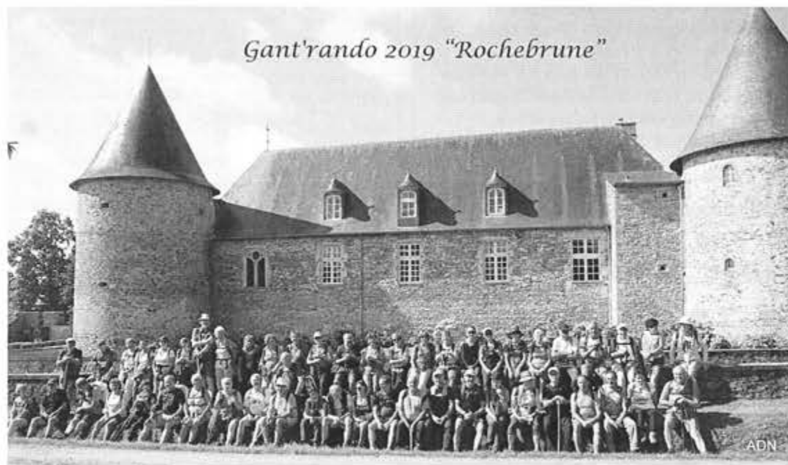
Gant'rando 2019 "Rochebrune"