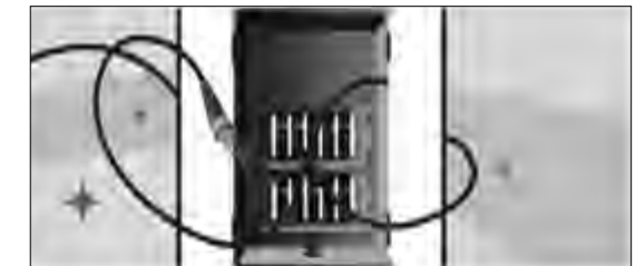
Schéma d'une armoire

vers les habitations. Les travaux sont prévus pour 2023 pour les 507 logements de la commune.