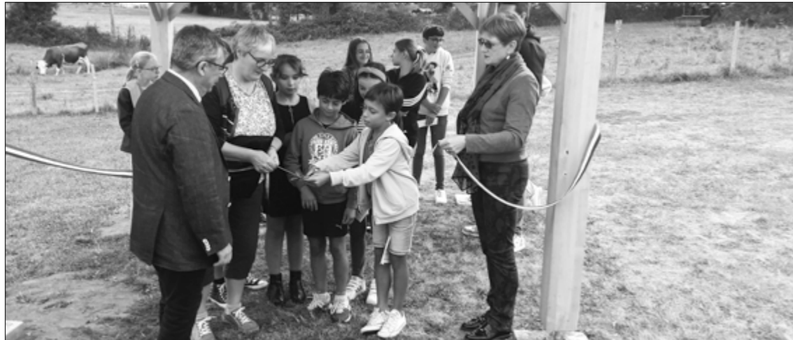
Inauguration du Kiosque, le samedi 10 septembre