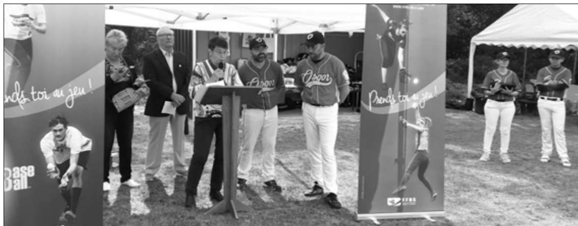
Inauguration du stade de base-ball, le samedi 3 septembre