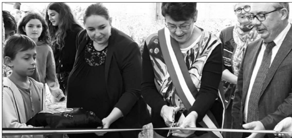
Inauguration de la 3 ème tranche des travaux du centre bourg, le samedi 10 septembre