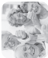
ATELIERS DE CONVIVIALITÉ