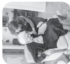
ASSISTANCE A LA PERSONNE

Un seul objectif : « Mieux vivre chez soi »