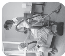
ENTRETIEN DU DOMICILE