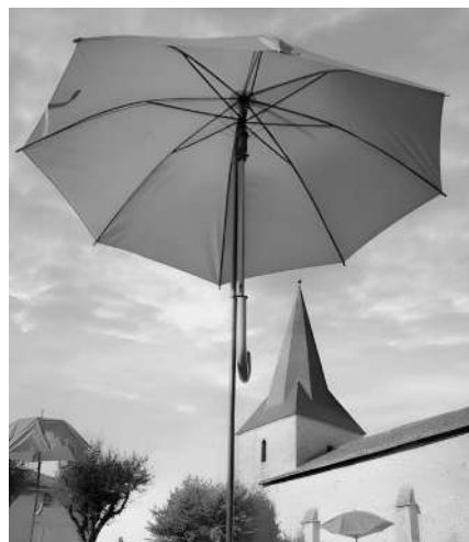
Parapluies achetés par Madame le Maire sur ses fonds propres.

Enfin, c'est une manière d'apporter notre soutien à toutes les personnes touchées - des femmes bien sûr, mais aussi des hommes - et de briser le tabou, de libérer la parole autour du cancer du sein.