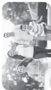
ASSISTANCE AUX FAMILLES