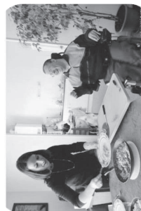
ASSISTANCE AUX PERSONNES EN SITUATION DE HANDICAP

Un seul objectif : « Mieux vivre chez soi »